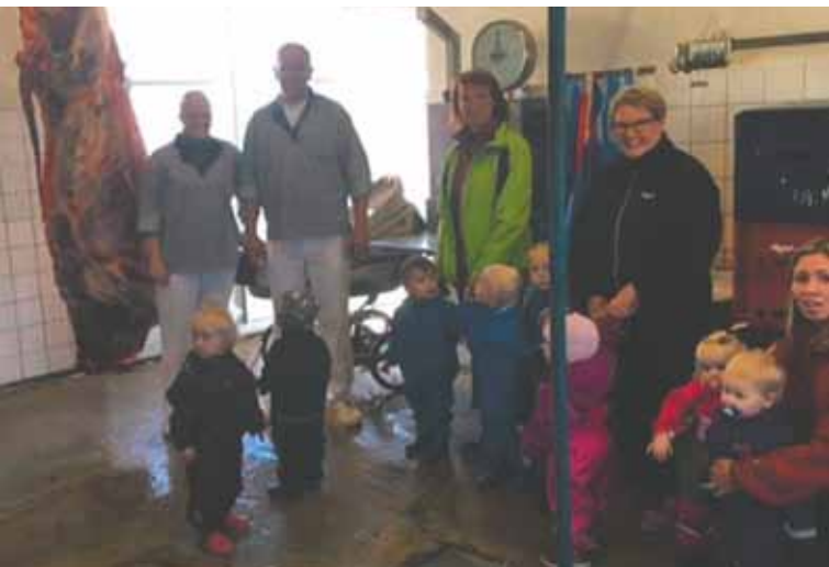
Billedet herover er fra vores besøg hos Vester Aaby Slagterforretning.

Vi har besøgt "vores" køer på Frisenvænge. Altid en rigtig god oplevelse for børnene, hvor vi kommer tæt på køerne.