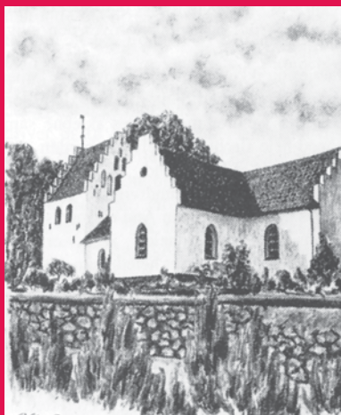
VESTER AABY KIRKE