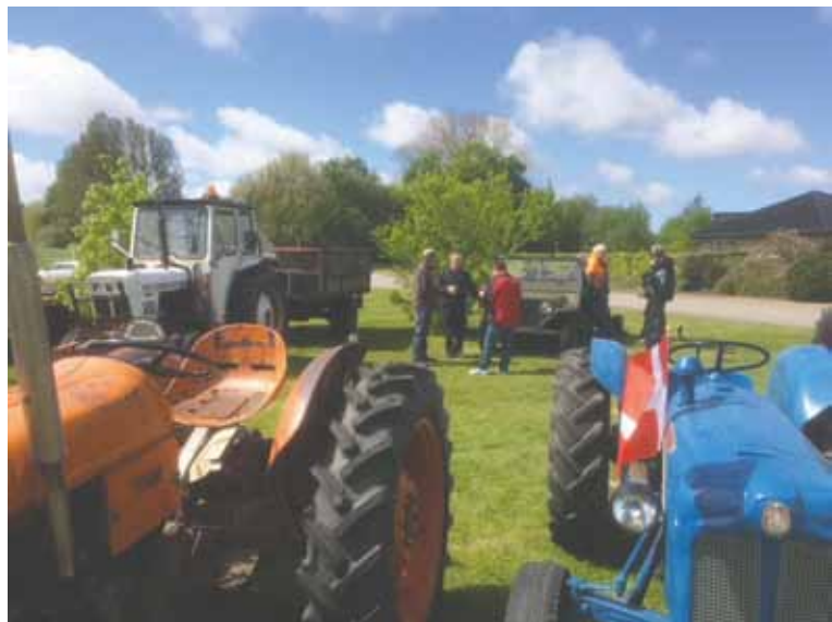
Billederne på siden er fra udstilling ved markedesdag i Korinth 2017.

Nysgerrige sjæle er også meget velkomne til at kigge forbi vores arrangementer, hvor der altid plejer at være en hyggelig stemning.