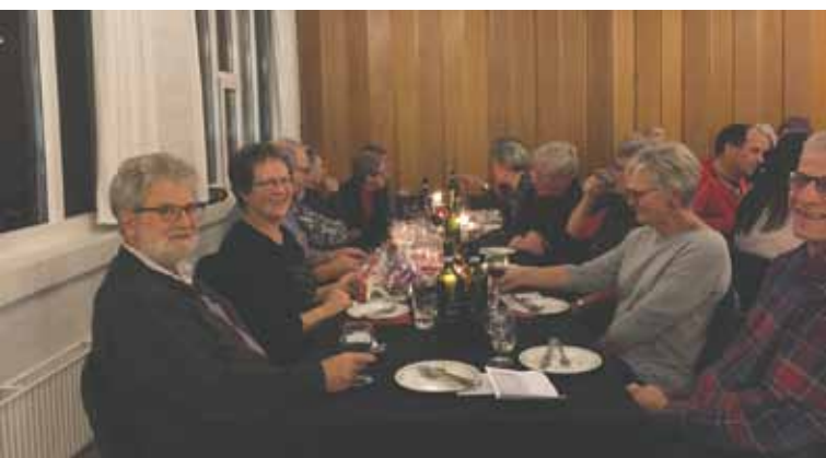
Billederne på siden er fra den årlige julehygge.

2. halvdel af indendørs sæsonen er i gang. Hallen bliver flittigt brugt både til hverdag og i weekenderne. Det er rart at se, at der er fremgang i de fleste sportsgrene. Pladserne på spinningholdene om morgenen er fuldt booket flere gange om ugen. Der er nu 2 formiddagshold i hallen hver uge, og eftermiddags- og aftentimerne er også stort set booket. På tværs af idrætsgrene deles pladsen i hallen med stor respekt for hinandens idrætsgrene. Det er dejligt, at det kan lade sig gøre.