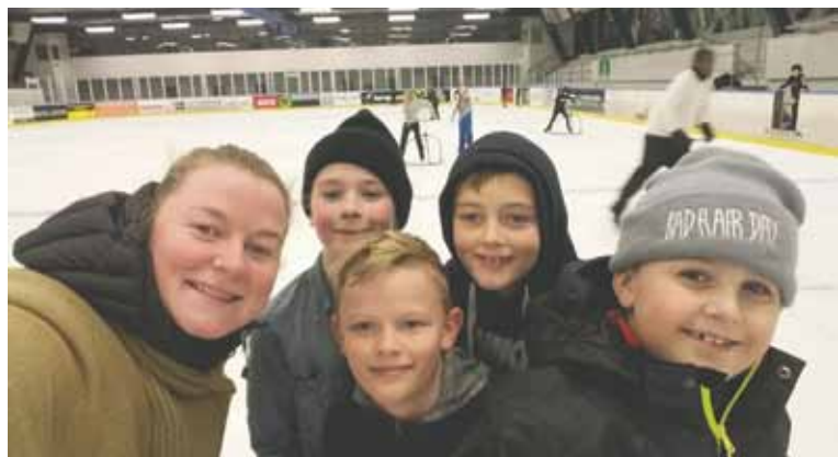
Herover et billede fra dagen, hvor 2. og 3. klasse var i skøjtehallen.

Det skyldes blandt andet at vores SFObygninger er meget slidte, så her tænker vi, at der skal etableres en ny SFO inden for skolens eksisterende lokaler, og sandsynligvis vil der blive flyttet meget rundt på mange af de eksisterende lokaler.