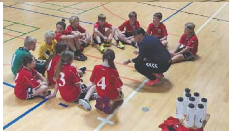
Billederne er fra U12 børnenes første kamp efter jul, hjemme i Bøgebjerghallen tirsdag d. 9. januar.

Så nu krydser vi fingre for, at de får en sejr i denne halvsæson.