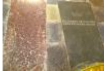
Valdemar den Unge såvel som hans

gemahlinde Eleonora ligger begravet i Sct. Bendts kirke i Ringsted Svendborg omtales første gang i et dokument udstedt i Ribe den 25. juni 1229 i anledning af brylluppet mellem kong Valdemar II's søn, den unge udvalgte kong Valdemar og den portugisiske prinsesse Eleonora (Alienor).