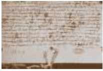
Morgengave brevet 1229

Skrevet af Hans Nørgaard , Fre, 2008-03-07 09:53 Middelalder (år 500-1500) | Herregårde | Højtider | Svendborg købstad