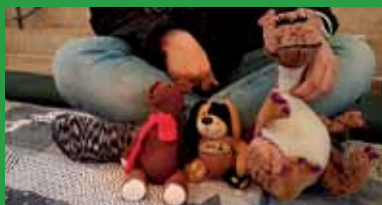
Plysdyr på eventyr