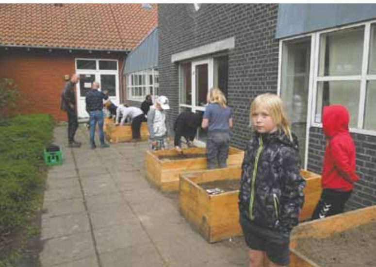
3. klasse igang med klargøring til at plante i "LOMA" højbedene.

Vi afviklede også et andet arrangement i februar, som er en af de tilbagevendende begivenheder, nemlig årets skolekomedie, som 6. klasse traditionelt står for. I år opførte klassen "Olsen og Mcnicecream", og det gjorde de helt fantastisk. Eleverne spillede deres roller på allerbedste vis, de talte højt, og nogle endda på engelsk! Der var naturligvis også voksne omkring klassen, som ydede et stort stykke arbejde for at få et så godt resultat som muligt.