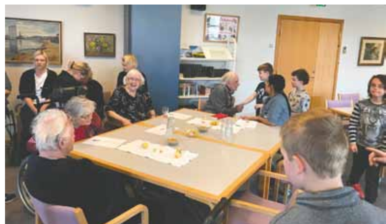
2.klasse på besøg på plejehjemmet.

Vi har fået en ny elev i 2. klasse, som kommer fra Øhavsskolen, og vi kan glæde os over, at der er rykket 14 børn fra børnehaven og over i vores forårs-SFO, som nu holder til i SFO lokalerne. Efter sommerferien vil de blive vores nye børnehaveklasse.