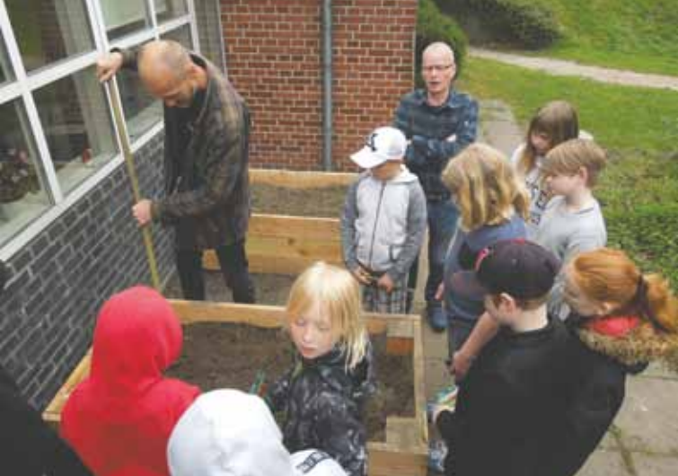
3. klasse er med til at så til LOMA.