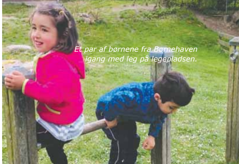
Et par af børnene fra Børnehaven igang med leg på legepladsen.

SFO-børnene giver de nye børn en hjælpende hånd i løbet af eftermiddagen og tager dem med i lege og aktiviteter.