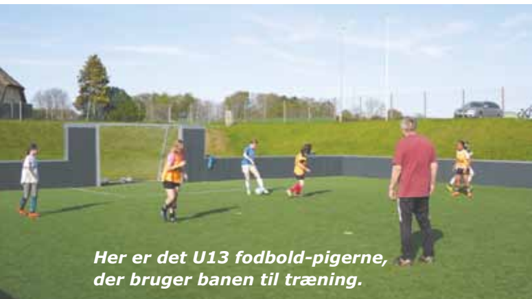
Her er det U13 fodbold-pigerne, der bruger banen til træning.

Ydermere vil der blive påbegyndt reetablering af græsarealet omkring skaterbanen.