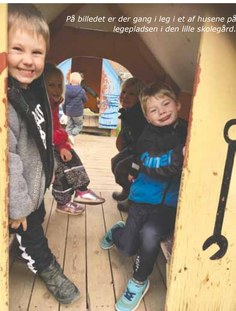
På billedet er der gang i leg i et af husene på legepladsen i den lille skolegård.