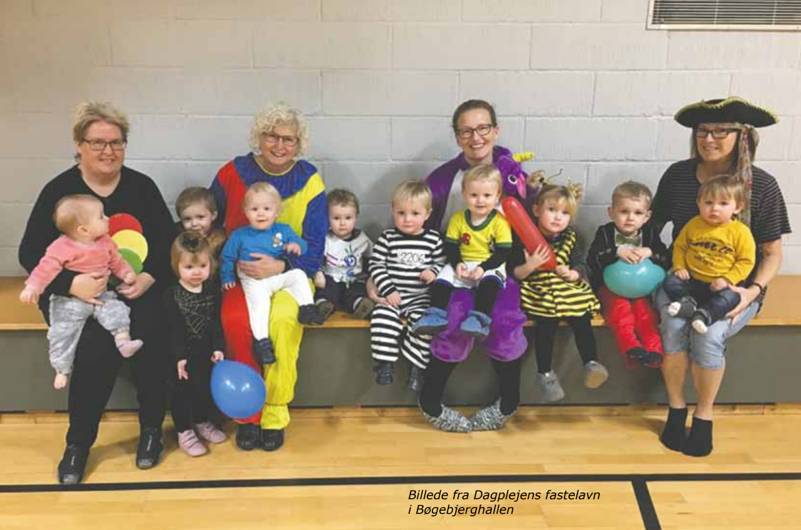
Billede fra Dagplejens fastelavn i Bøgebjerghallen