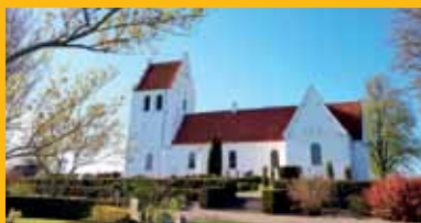
Vores smukke kirkegårde