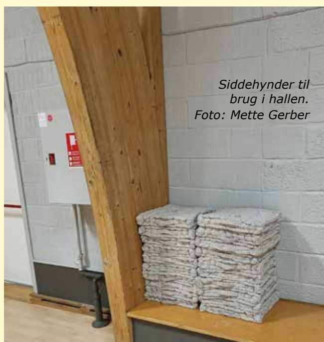
Siddehynder til brug i hallen.