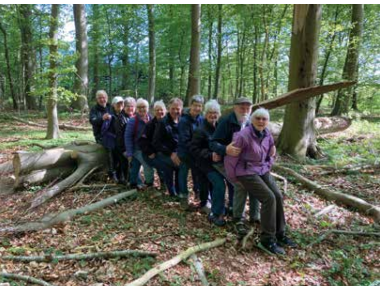
Holdet på skødet af hinanden i Pipstorn Skov.

Vi fortsætter træningen i skoven indtil midten af december, og starter et nyt hold i sidste del af februar 2025.