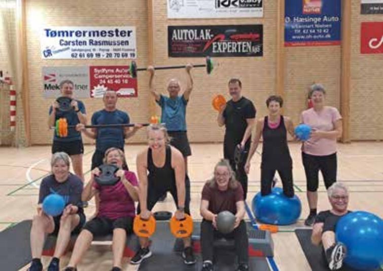
Musktræningsholdet er så klar til at tage det nye udstyr i brug.