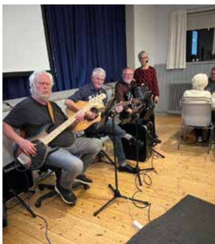
Musik fra Hjerttet.

Næst på programmet er Spillegilde d. 4. november og Familiejulefrokosten, som også ligger i november.