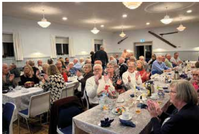
Fra fællesspisning i forsamlingshuset