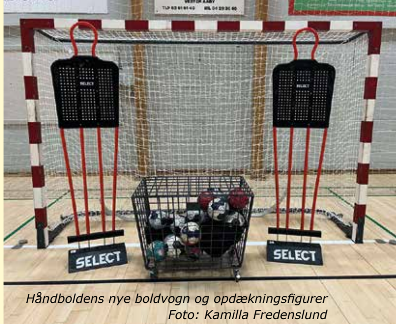
Håndboldens nye boldvogn og opdækningsfigurer

At have en boldvogn sikrer længere levetid for vores bolde, derudover har vi også købt to opdækningsfigurer.