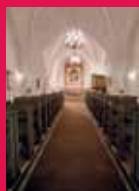
De 9 læsninger