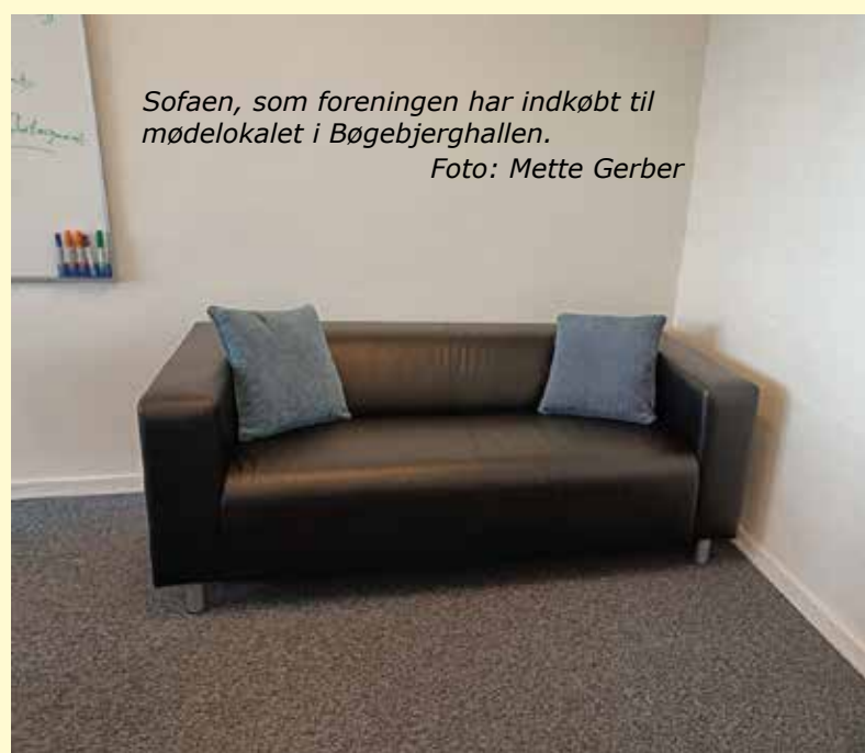
Sofaen, som foreningen har indkøbt til mødelokalet i Bøgebjerghallen.