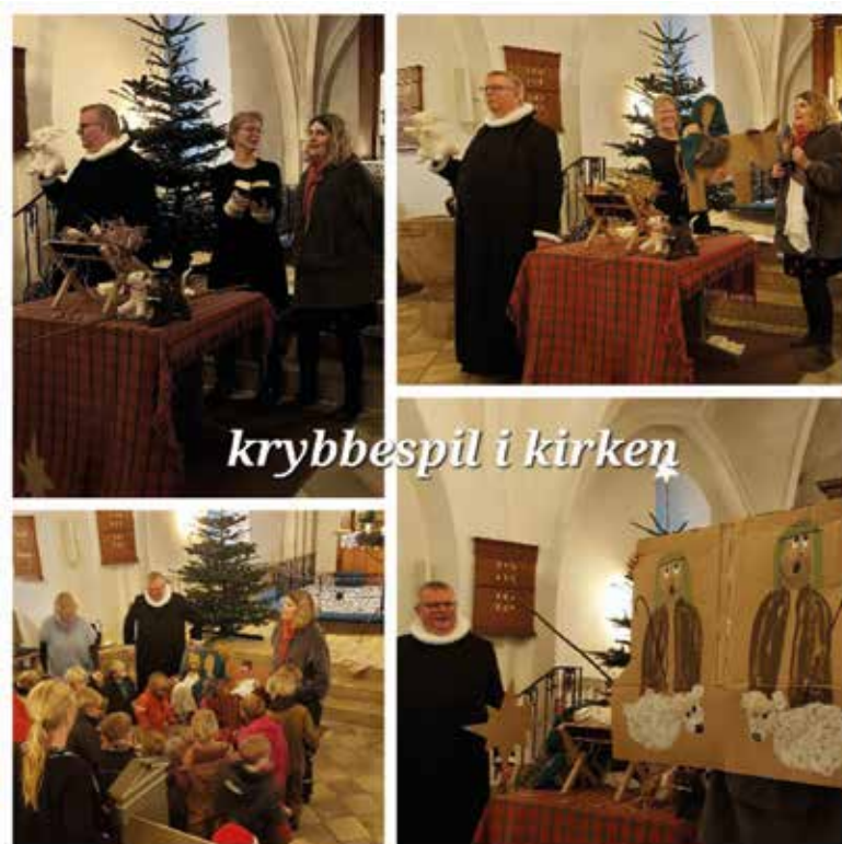
krybbespil i kirken