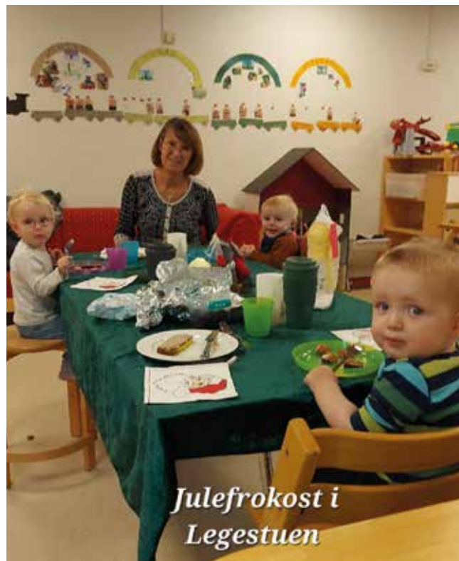
Julefrokost i Legestuen