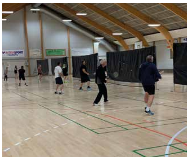
Der spilles med tildækkede net til juleafslutningen.

Mandag den 24. marts 2025 kl. 19.00 - 22.00 afholdes der klubmesterskab med efterfølgende spisning i Bøgebjerghallens Cafeteria.