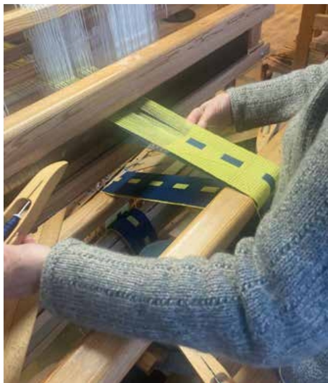
Dobbelt vævning, strop til taske. Væver Marianne Skåning.