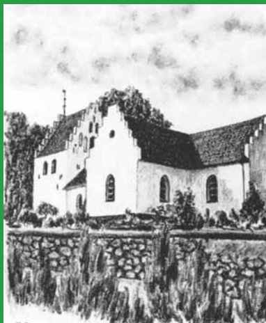
VESTER AABY KIRKE