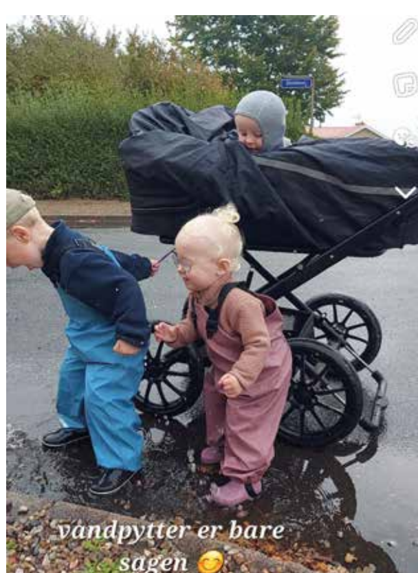
vandpytter er bare sagen 😊

Billederne på denne side er taget af dagplejerne.