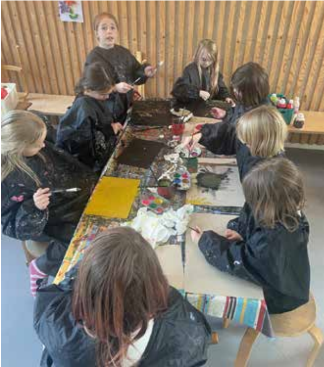
En gruppe børn i gang med at male.