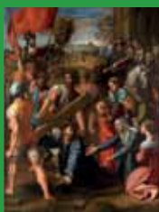
Alle veje fører til Rom