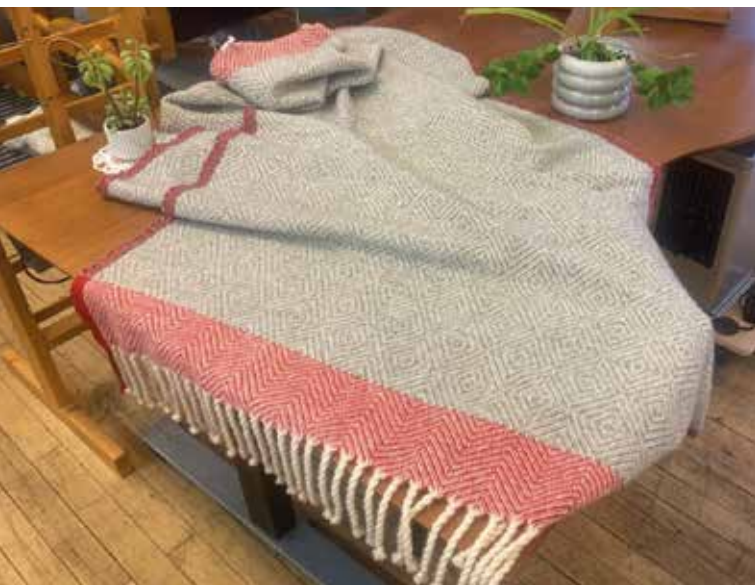
Uldtæppe vævet af Liss Brandt.