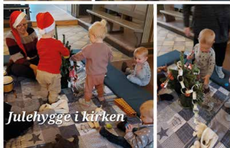
Julehygge i kirken