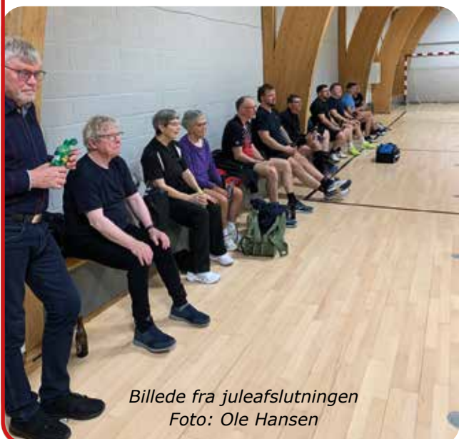
Billede fra juleafslutningen

Fra udvalgets side skal der lyde en stor tak til Bjarne.