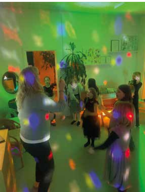
Fritterfest for 2. og 3. klasse